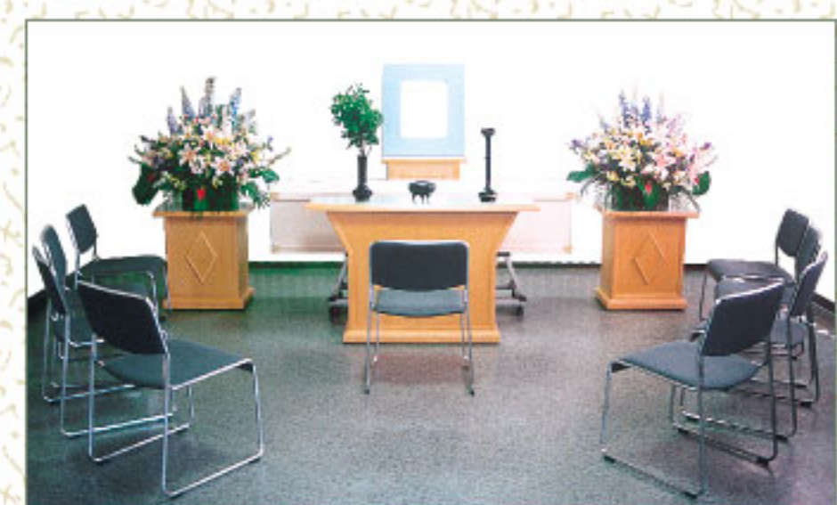
※白木祭壇飾付と生花祭壇飾付が選んでいただけます。