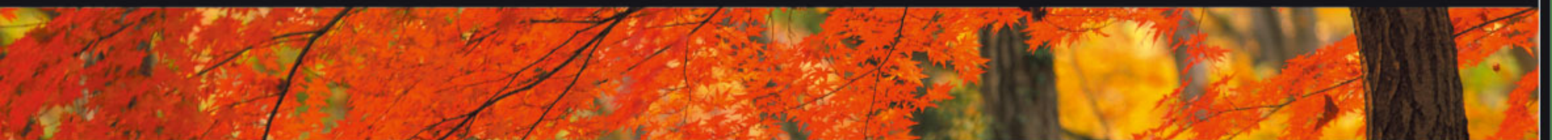
Final Ceremony in Kojakuin